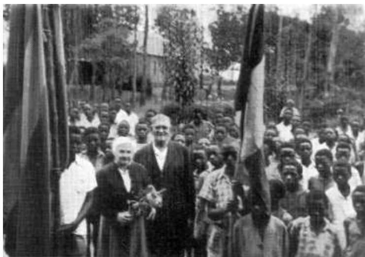
Vårt avsked i Machumbi, Masisi i januari 1956.