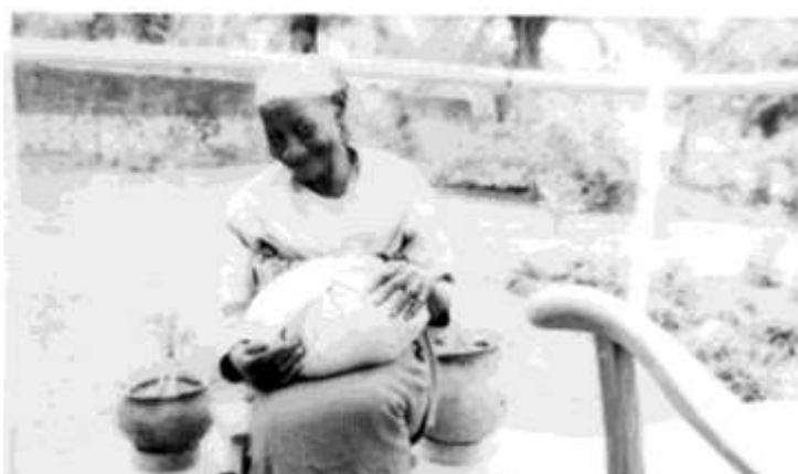
Ett paket kläder från Köping är orsaken till kvinnans glädje